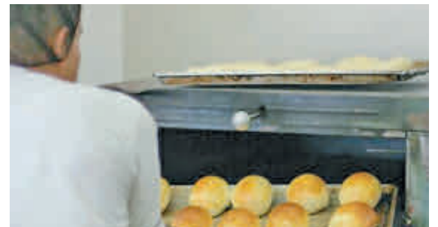
La panadería está ubicada en la sede de la fundación. Todos los trabajadores de este lugar hacen parte del centro de ayuda.