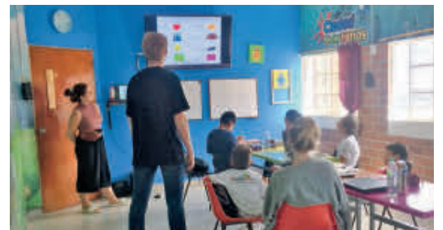
En aulas como estás voluntarios de Alemania brindan clases de su idioma a los niños.