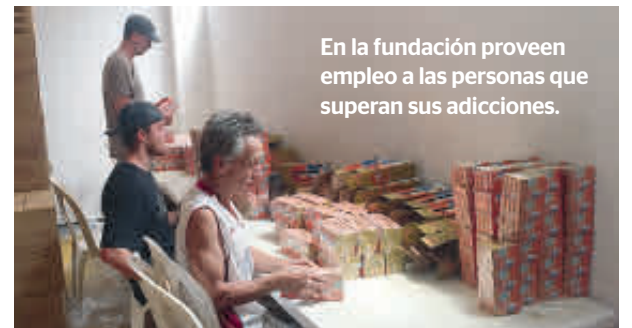
En la fundación proveen empleo a las personas que superan sus adicciones.